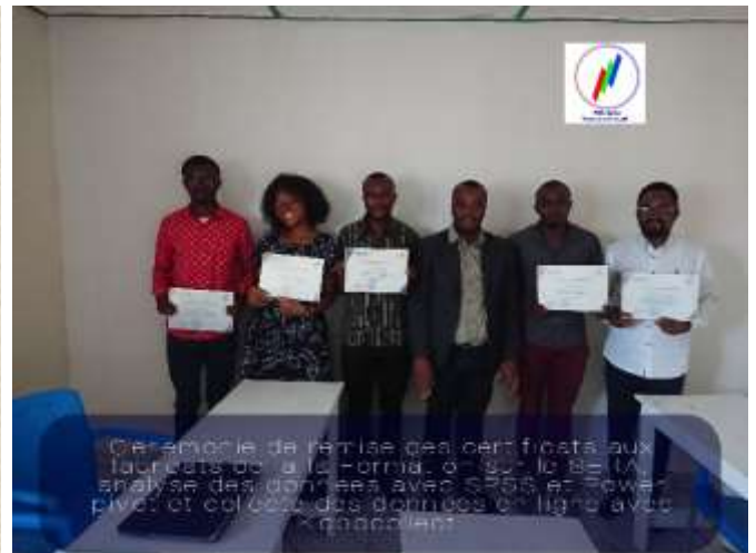
Image 1. Formation des personnes désireuses de l'améliorations sur le suivi et évaluation, technique de collecte des données avec le plateforme Kobocollect et Google form et en Analyse des données avec SPSS et Excel avance,